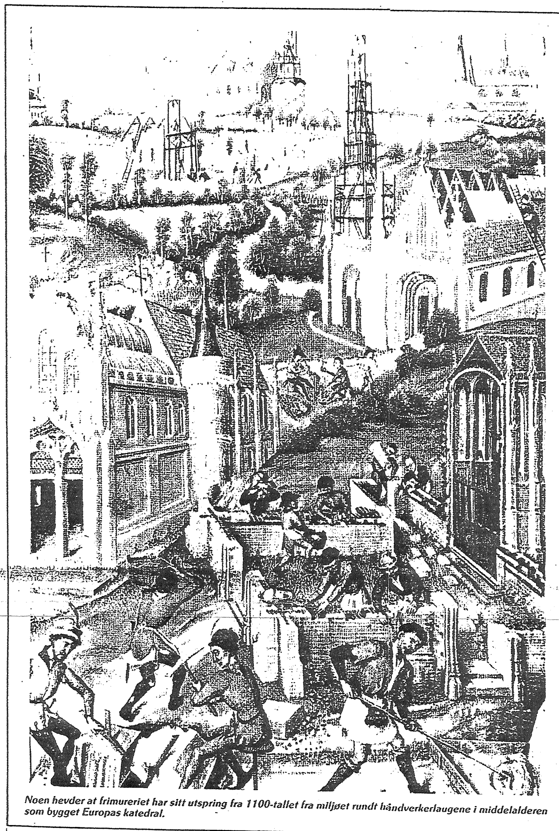
Noen hevder at frimureriet har sitt utspring fra 1100-tallet fra miljøet rundt håndverkerlaugene i middelalderen som bygget Europas katedraler.

hver til at det utviklet seg to frimureriske retninger. Den ene retningen ble påvirket av humanisme og en sosialliberal tenkemåte, mens den andre retningen ble en romantisk reaksjon mot rasjonalismen. Dette førte også med seg en oppblomstring av mystisismen og okkulte fenomener. Det engelske frimurersystemet var altså i ferd med å bli «utvannet».