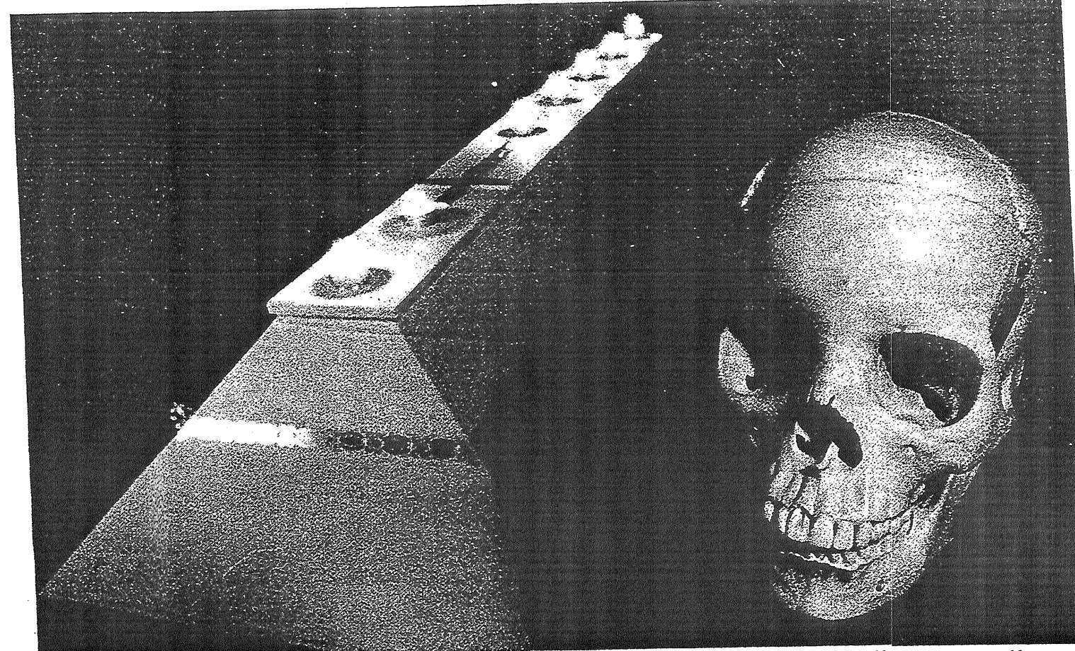
Opptaksritualet i frimurerlosjen blir en rystende opplevelse for mange. Møtet med hodeskallen er en del av opptakskravet. Mange reagerer med harme, mens andre står løpet ut og avgir en omfattende ed.

Her møter du også for første gang dødningskallen. Da blir du