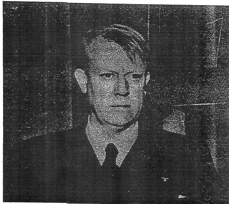
Opprøret mot frimurerne var et av de alvorligste mot Vidkun Quisling og NS' ledelse.